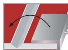
Pliage avec une règle