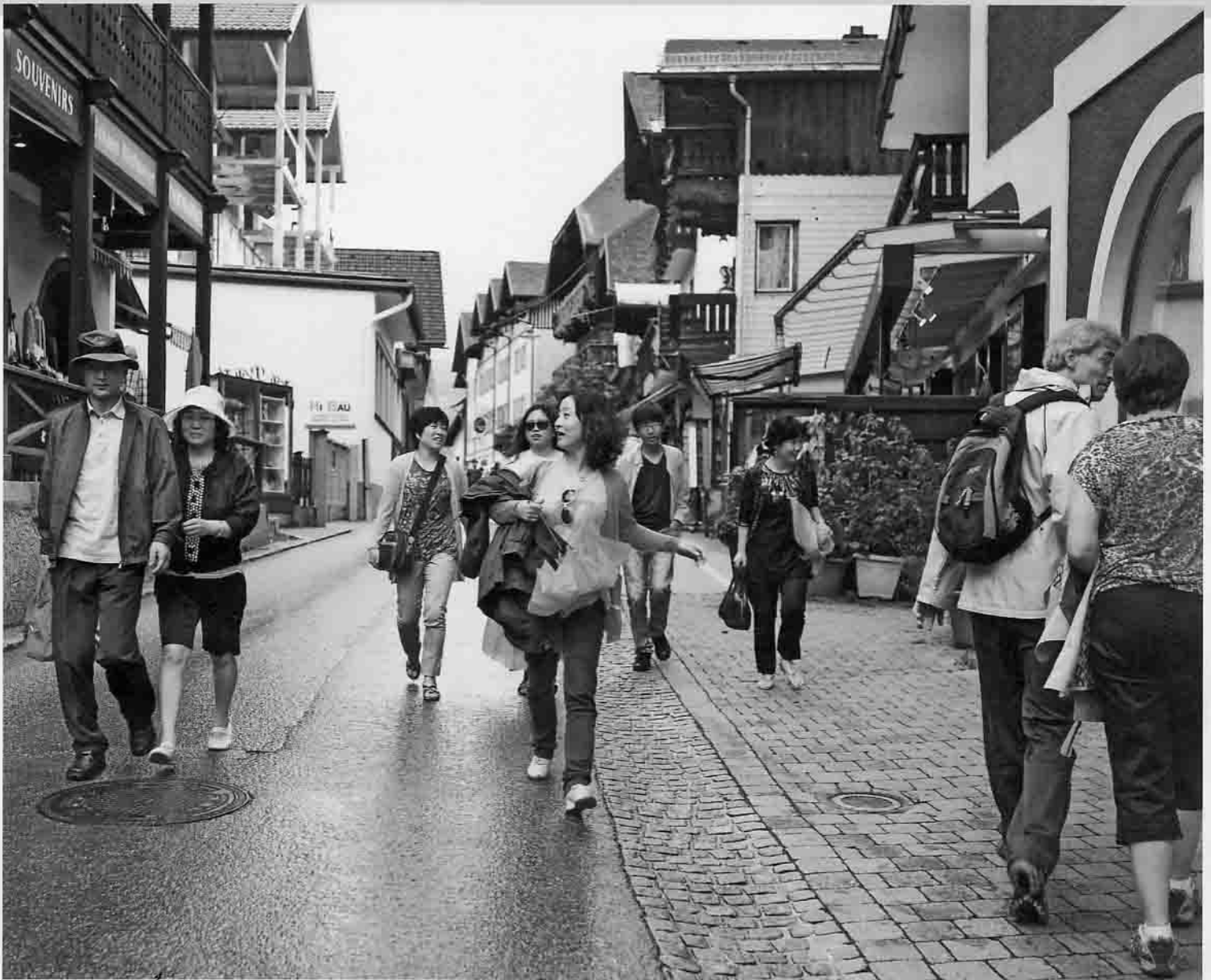
St. Wolfgang Heute wimmelt es nur noch, wenn gerade eine Reisegruppe durch den Ort getrieben wird