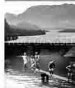
Marie-Theres Arnbom: „Wolfgangsee“. Christian Brandstätter Verlag, 208 S., EUR 49,90