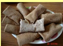
❖ Galette au poulet et à la citronnelle