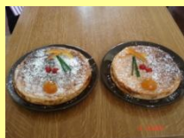
❖ Nougats de Tours