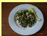
❖ Salade de lentilles aux pommes sauce curry