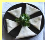
❖ Bricks de mâche à la Fête