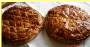
❖ Galette des Rois