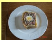
❖ Pâté de Pâques