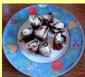
❖ Maki kiwis au riz-au-lait