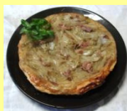
❖ Tatin d'endives au confit de canard