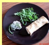
❖ Crêpes aux rillettes de sardines et roquette