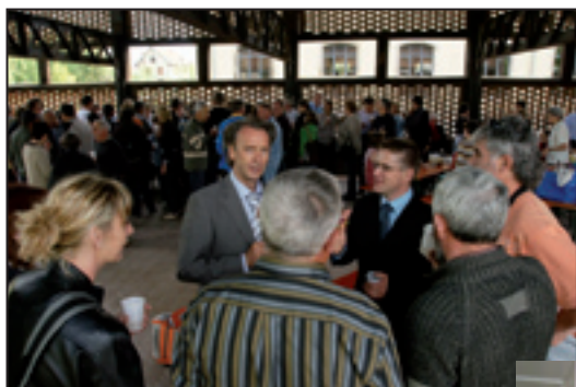
Rencontre le 2 mai avec des représentants du Conseil municipal de Montperreux.

J'ai eu maintes fois l'occasion de rencontrer des élus lors de manifestations conviviales et instructives.