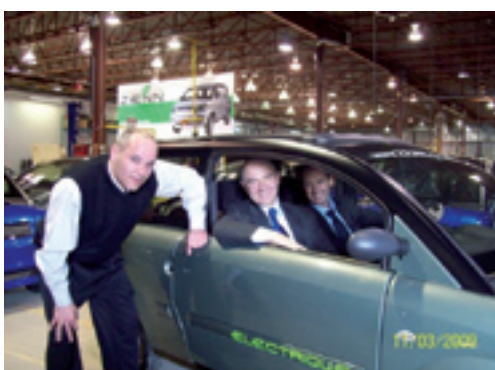
En visite dans une usine de fabrication de voitures électriques à Québec.