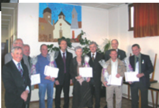
Remise de décorations aux élus de Montécheroux

J'ai eu maintes fois l'occasion de rencontrer des élus lors de manifestations conviviales et instructives.