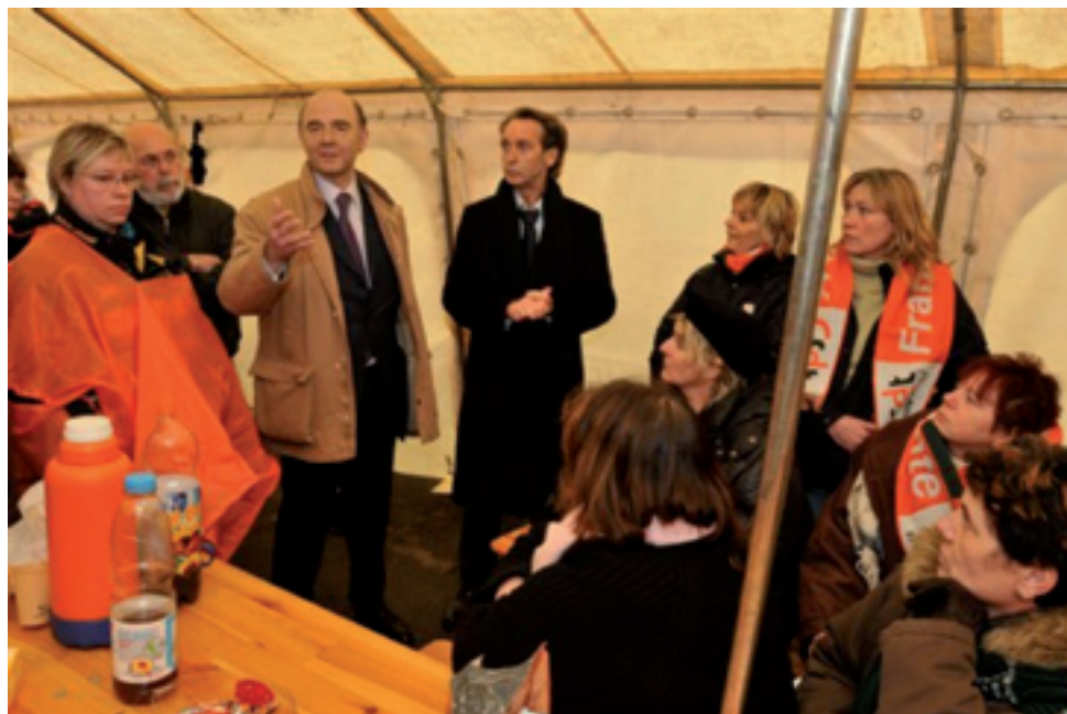
Avec les salariés de Key Plastics