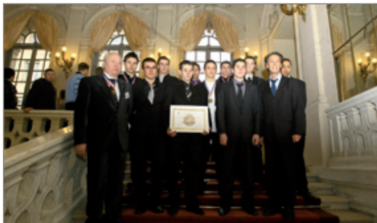
Le 20 janvier, je suis très fier de féliciter les lauréats franc-comtois du concours des meilleurs apprentis de France qui étaient invités au Sénat.

Je pose une question au gouvernement sur la crise économique et l'absence de mesures importantes du plan de relance gouvernemental en faveur de l'automobile . « Lorsqu'on garde une voiture plus de dix ans, c'est non pas par choix, mais parce que l'on ne peut pas en acquérir une neuve ! Si vous voulez que nos concitoyens puissent acheter un véhicule neuf, il faut leur donner du pouvoir d'achat ».