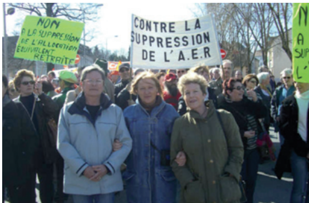
Le collectif AER