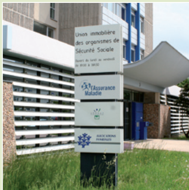
La Caisse Primaire d'Assurance Maladie et la Caisse d'Allocations Familiales de Montbéliard concernées par le projet.

en quelques mois et nous avons besoin de ces emplois de service. Il est temps de revoir votre copie sur les CPAM. Et ne parlons pas de rationalisation : un département de 120 kms de long mérite 2 caisses primaires d'assurance maladie, comme il y en a toujours eu historiquement ! ».