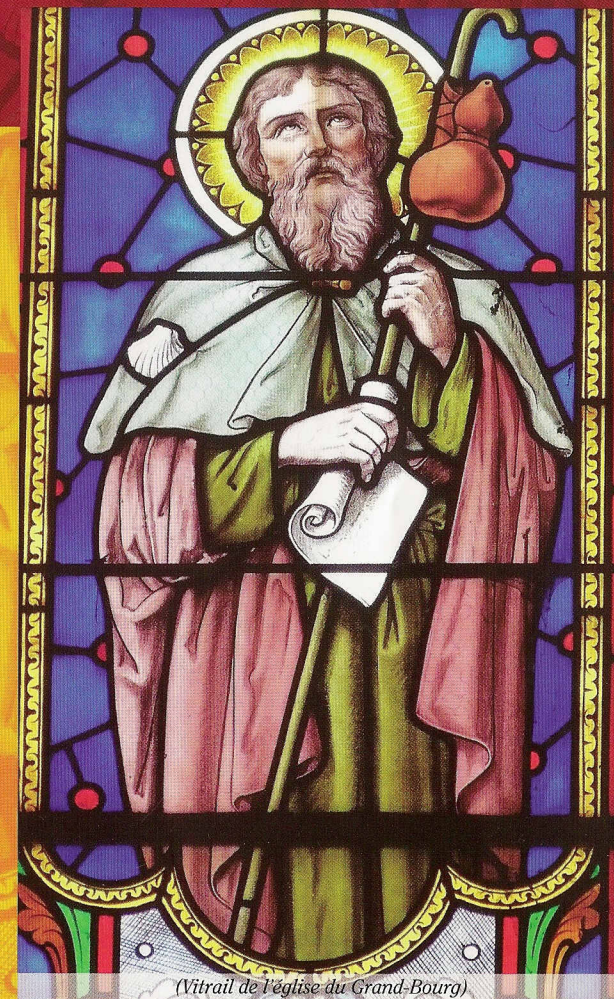
(Vitrail de l'église du Grand-Bourg)

Haltes spirituelles en Creuse et en Haute-Vienne sur la voie de Saint-Jacques venant de Vézelay