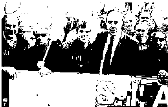
Le delegazioni piacentine del Siap e del Sap ieri alla manifestazione di Roma