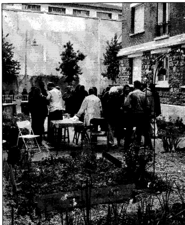
156, RUE RAYMOND-LOSSERAND (XIV e ), SAMEDI. Ce jardin a été inauguré en présence du bailleur, Paris Habitat, de dizaines de locataires et de Pascal Cherki, le maire (PS) du XIV e .