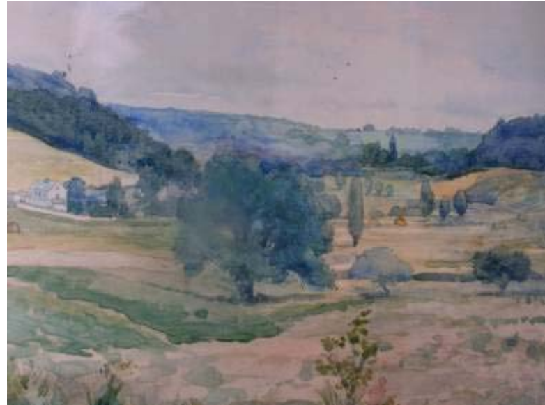
Aquarelles de Madame A. FARDEL