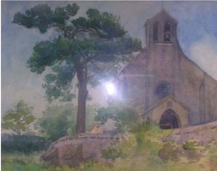
Assemblée Générale Ordinaire 26 Avril 2008

association des amis de la Vallée du rhodon et de ses environs