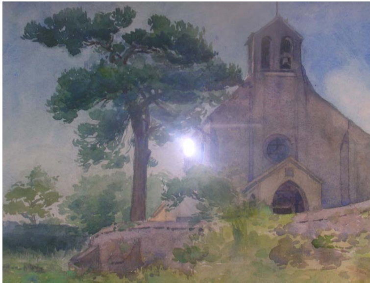
Église de Saint Lambert des Bois

association des amis de la Vallée du Rhodan et de ses environs