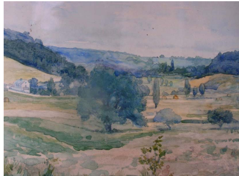
Moulin de Fau-vaux