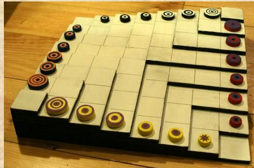
position à 4 joueurs