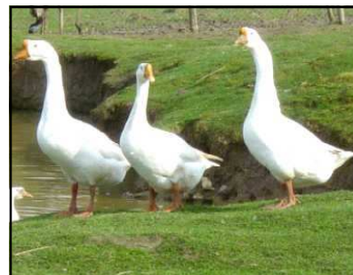
Oie de Guinée blanche