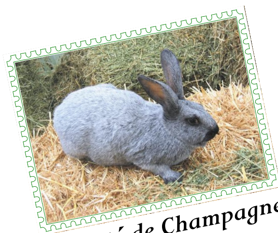
Argenté de Champagne