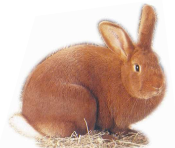
Fauve de Bourgogne