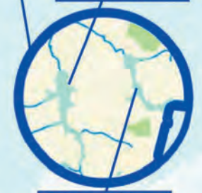
Barrage de Lavaud (220 ha)