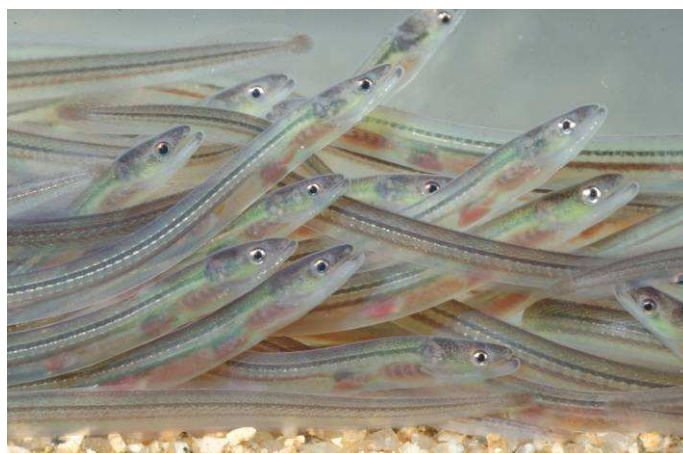
Alevins d'anguille ou "civelles"

Le chapitre de la Liste rouge nationale consacré aux poissons d'eau douce de France métropolitaine a été élaboré par le Comité français de l'UICN et le Muséum national d'Histoire naturelle, en partenariat avec la Société française d'ichtyologie et l'Office national de l'eau et des milieux aquatiques. Cette analyse permet de déterminer le degré de menace qui pèse sur chacune de ces espèces sur le territoire métropolitain. On entend ici par poissons "d'eau douce" toutes les espèces qui effectuent au moins une partie de leur cycle de vie en eau douce, pour leur croissance et/ou pour leur reproduction.