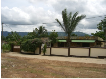
La villa « Chez Thérèse »