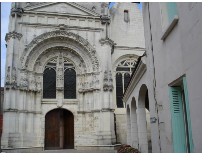
Eglise Saint-Pierre du Marché