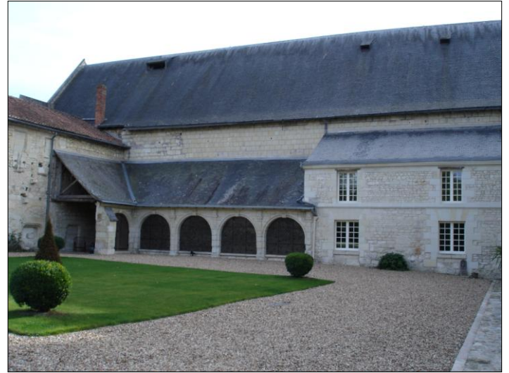
Ancienne école des élèves sourds de 1838-1856 à la cour du Couvent des Carmes