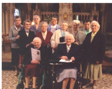
Les Sœurs Oblates de la Sagesse