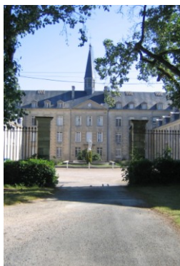
La cour d'honneur de Larnay