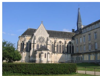
La chapelle Notre-Dame

(extrait de la Préface de « Ce Bon Père, Monsieur de Larnay »)