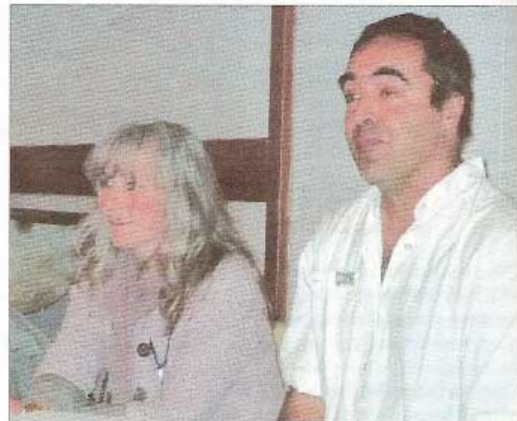
Les responsables du groupe Uzège d'Écohabiter 30

Attention, on est loin des communautés des années 1970. « On achète en commun au départ, mais chacun finance individuellement et chacun est propriétaire de sa maison. C'est un projet collectif auquel on adhère et on peut aussi décider ensemble d'y favoriser la mixité, pourquoi pas en proposant aussi des logements locatifs. Tout est possible, c'est une simple question de précision juridique ».