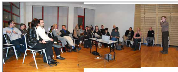
réunion d'information à Nîmes

Au départ des projets il y a toujours des personnes qui souhaitent un habitat différent de ce qu'on propose habituellement. Ils se regroupent spontanément avec des amis ou des collègues qui partagent ces valeurs. Un autre moyen de rencontrer des partenaires et futurs voisins est la participation aux activités d'une association qui poursuit le but de faire connaître ce concept.