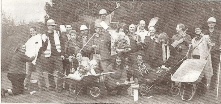
Un petit groupe d'autopromoteurs très motivés.

À l'heure où l'on parle un peu partout de la menace climatique, de développement durable, d'éco-quartier..., les membres de l'association Écohabiter 30 veulent agir au travers de l'habitat. Leur but : faciliter l'émergence de projets en auto-promotion dans le Gard.