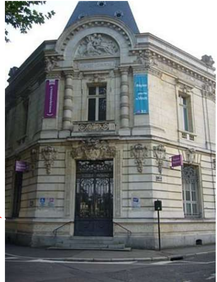
ESPACE REGIONAL LAVAL

Achats réalisés lorsque l'immobilier coûtait le plus cher!