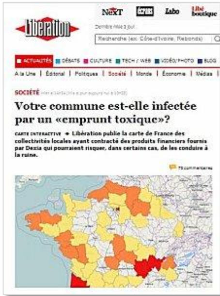
"Libération" - Mardi 20 septembre 2011

Depuis des années, nous dénonçons fortement la mauvaise gestion de la municipalité Garcia. Il faut savoir qu'à Auriol, entre 2001 et 2010, la dette de la commune a augmenté de plus de 226% (sources : chiffres publiés par le Ministère du Budget et des Comptes Publics).