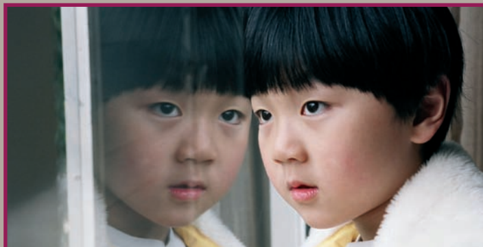
ISRAËL · 2007 · 1H35 · VOSTF A PARTIR DE 8 ANS