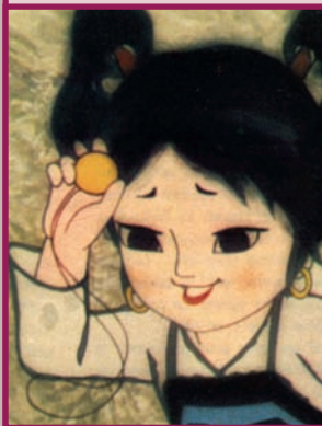
LE GRELOT DU FAON, TANG Cheng, 1982.