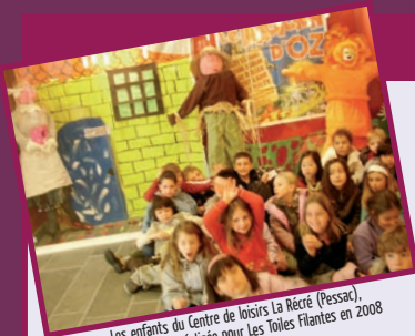
Les enfants du Centre de loisirs La Récré (Pessac), devant la vitrine réalisée pour Les Toiles Filantes en 2008