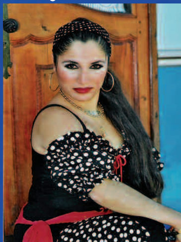
Niña de Fuego