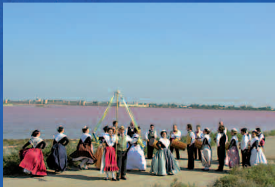
Le temps du costume