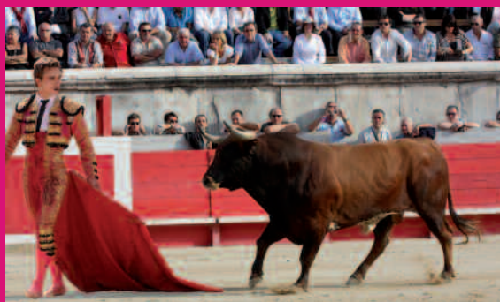
Pour la première fois de sa carrière, Juan Bautista affrontera les taureaux de Miura (photo montage)