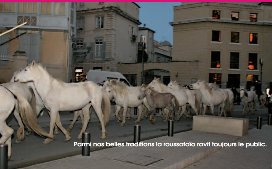
Parmi nos belles traditions la roussataïo ravit toujours le public.

Le 1 er juin à 16 h 15, tout l'esprit de la Camargue animera le centre de la Ville au son des galops de chevaux Camargue. Les boulevards ceinturant l'Ecusson seront effectivement livrés aux gardians qui encadreront les juments et leurs poulains de l'année pour un festival de roussataïo réunissant 12 manades (Layalle, Vinuesa, Fourmaud, de Meyranne, du Vent large, du Cœur, Saliérene, Robert Michel, Gros, Marie, Puig et du Colombier) et quelque 400 animaux. Ce festival se déploiera sur les boulevards à partir de l'avenue Feuchères en passant par les boulevards de Prague, Amiral Courbet, Gambetta, Alphonse Daudet, Victor Hugo, des Arènes avant de rejoindre l'avenue Feuchères pour l'arrivée. Le mot roussataïo vient du nom commun provençal rosso qui signifie cheval. ■