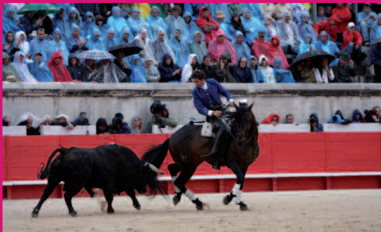
Pablo Hermoso de Mendoza