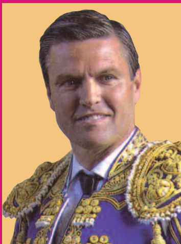
Espartaco

Castella, cinq oreilles et une queue), seront ensemble face aux toros de Zaldueño. Le lendemain, José Tomas retrouvera les arènes nîmoises. Depuis sept saisons, aucune arène du Sud-est de la France ne l'a programmé à l'exception de Nîmes en 2007. Chaque corrida de Tomas constitue un événement. La corrida pour laquelle il est annoncé à Barcelone le 5 juillet est déjà complète. Ce sera aussi le cas dans nos arènes le vendredi.