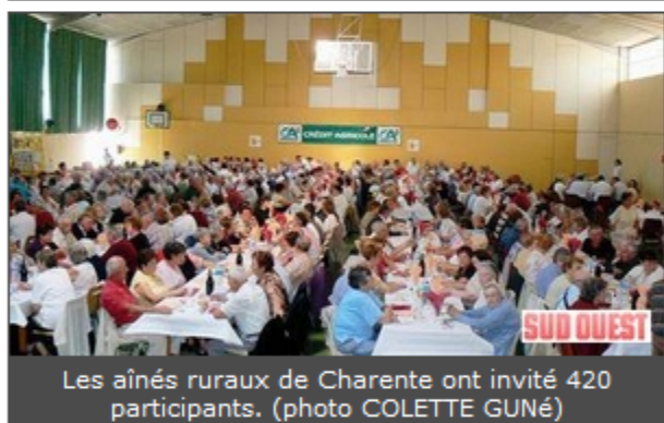
Les aînés ruraux de Charente ont invité 420 participants.

Ce mardi 29 septembre était un jour un peu particulier pour la Fédération des aînés ruraux de Charente qui regroupe 4 500 adhérents. Pour la première fois, étaient rassemblées, à Salles-d'Angles, 420 personnes venues des 60 clubs de Charente.