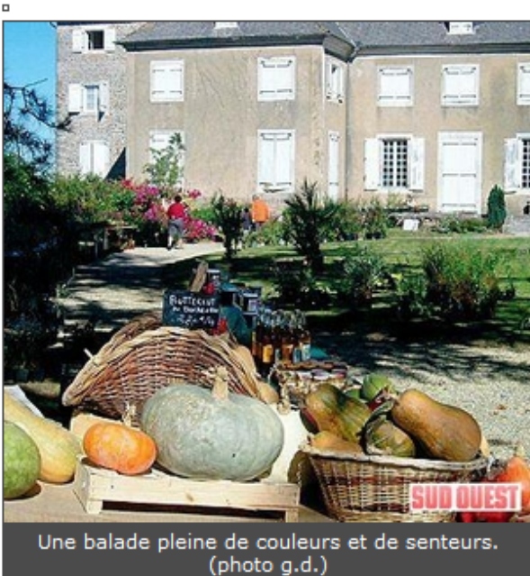
Une balade pleine de couleurs et de senteurs.

D'année en année, le village de Claracq voit joliment pousser sa fête horticole organisée par le Club des aînés ruraux de Claracq en partenariat avec la municipalité. Pour cette troisième édition les organisateurs ont ratissé large dans les expositions en sollicitant la Société d'horticulture et de botanique de Béarn et Soule sur le thème des plantes aquatiques, le club Bonzaï de Pau et ses végétaux artistiques, les enfants des écoles de Claracq et Carrère et leur travail sur le tri sélectif, le Siectom avec le compostage, l'atelier potier de Bouillon et le Conservatoire végétal d'Aquitaine qui proposera des variétés anciennes d'arbres fruitiers.