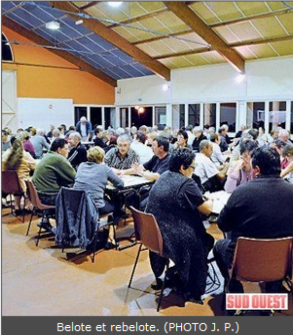
Belote et rebelote.

À l'occasion de leur 3e concours de belote, les aînés ruraux de Guiche, Tous unis, ont eu l'agréable surprise d'accueillir 52 équipes. Si le démarrage a pris du retard, affluence oblige, la soirée s'est ensuite déroulée dans la plus grande convivialité, surtout qu'un point « casse-dalle » bien achalandé permettait aux joueurs de se sustenter entre chaque partie.