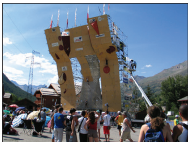
Photo du haut : escalade en falaise Au dessus : Masters de Serre Chevalier Ci-contre : coupe du monde de Valence