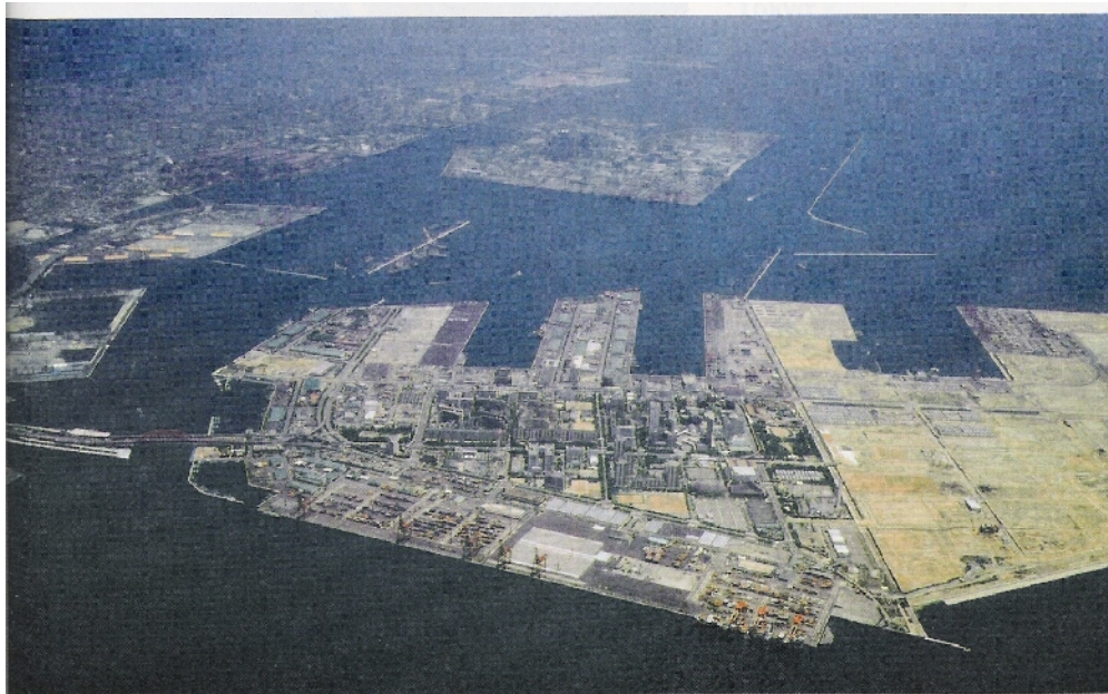
Document 3 : le littoral de Kobé. Au 1 er plan, île artificielle de Port Island