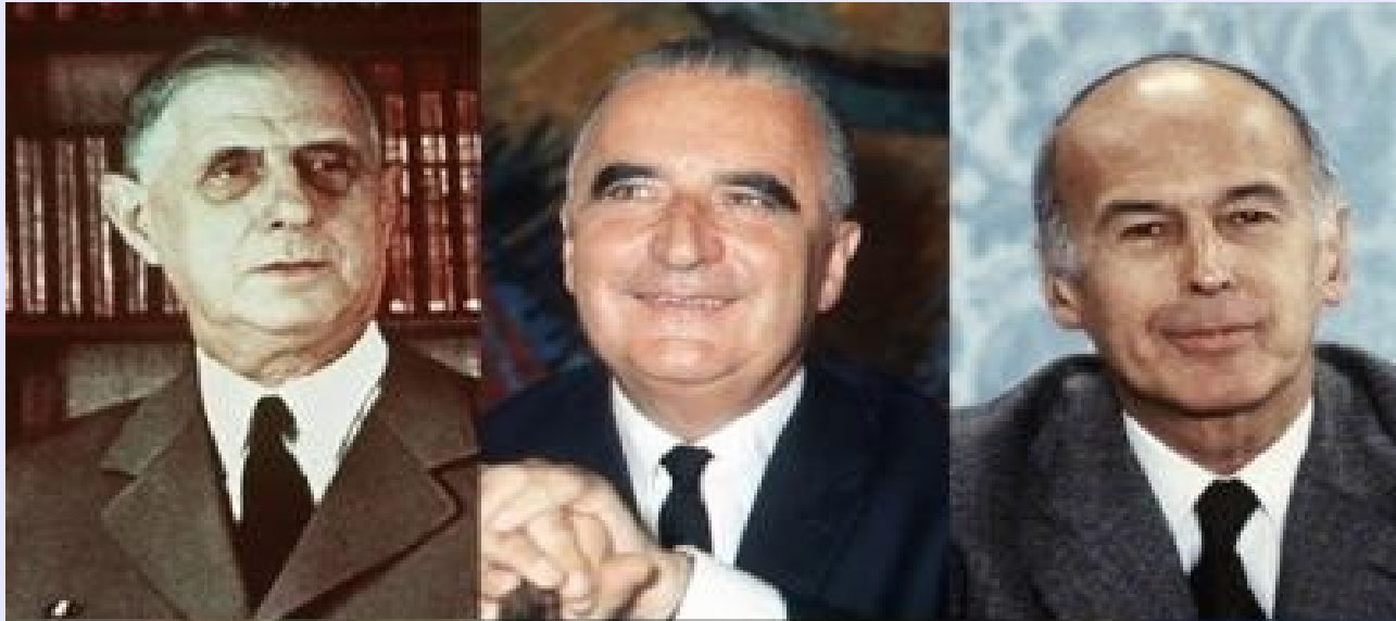
Georges Pompidou président de la République de 1969 à 1974