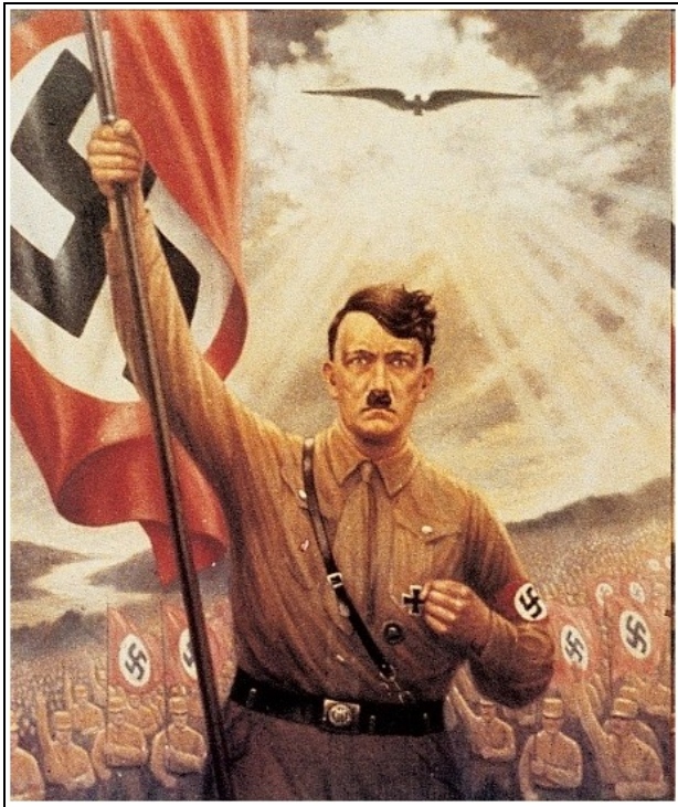
Document 2 Affiche allemande des années 1930 "Vive l'Allemagne"

1. Présente le document (nature, titre et date) (1 pt) :