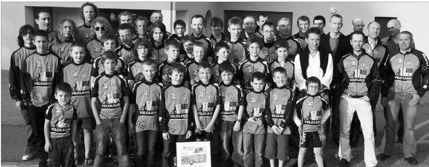
Les cyclistes de tous âges sont prêts à prendre la relève des frères Absalon sous les couleurs de la Vôge VTT.

Avec des effectifs en hausse, le club phare du VTT vosgien espère encore grandir pour assurer la relève de ses célèbres porte-drapeaux : les frères Absalon.