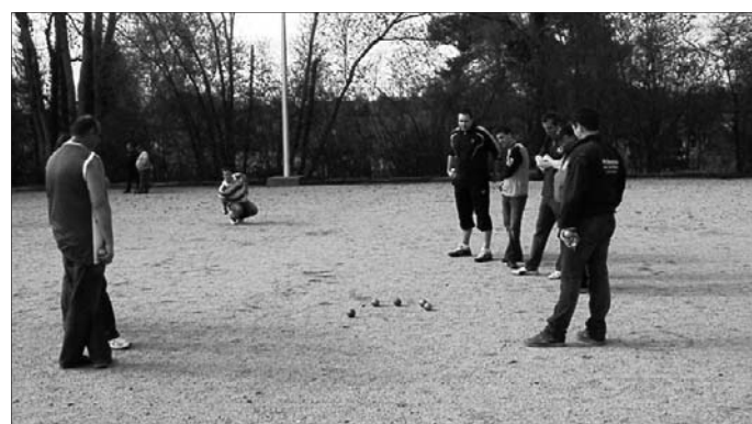
Après de longues parties, l'équipe de la localité a dû s'incliner en finale.