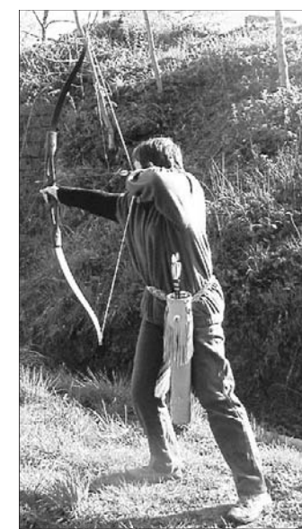
Les archers de l'Est de la France étaient à Sanchev.

En fin d'après-midi, tout le monde se retrouvait dans la cour du fort pour la lecture du palmarès et la remise des prix. L'heure était venue de se séparer et chacun d'insister sur l'excellente tenue de cette journée et de l'envie de revenir décocher des salves de flèches pour les prochaines compétitions.