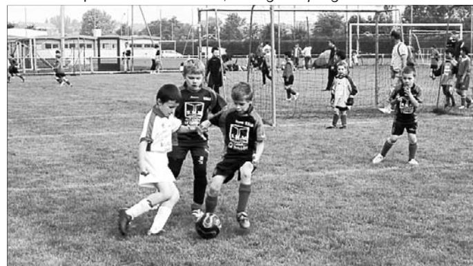
Au club de Charmes, on insiste sur les valeurs du foot.