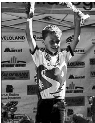
La relève du VTT est assurée dans les Vosges.