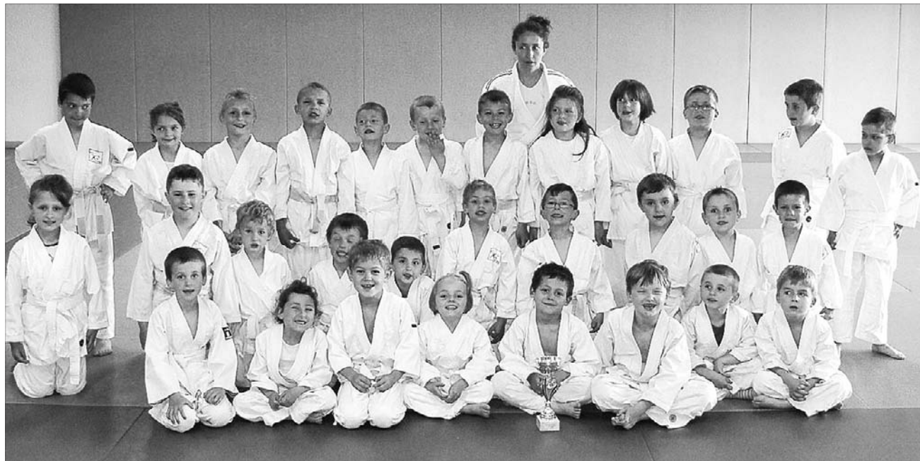
Les jeunes sont de plus en plus nombreux à rejoindre le club, signe de la vitalité du judo xertinois.