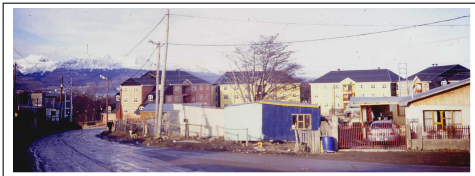
Photo III.1. Ushuaïa et l'hétéroclisme du bâti

Au moment des enquêtes et selon les migrants boliviens rencontrés dans le cadre de l'Association des résidents boliviens d'Ushuaïa, la majorité des migrants boliviens résident dans des casillas , c'est à dire des maisonnettes faites de matériaux divers (bois, tôle, contreplaqué, carton, etc.) agencés de manière parfois chaotique. Bénéficiant, durant les années de prospérité, de 1972 à 1994, d'un revenu stable, la majorité des migrants boliviens commencèrent à bâtir leurs casillas , dans la perspective de faire venir leurs épouses et/ou d'autres membres de leur famille vivant en Bolivie ou dans une autre localité argentine, principalement Buenos Aires et Salta. Le développement de ces habitations en grande majorité spontanées, illégales, dont le nombre demeure difficilement estimable, s'est fait d'abord dans les interstices libres (entre deux habitations légales) puis sur des terrains vagues non reliés aux réseaux d'électricité, d'eau, de communication de la ville. La multiplication des casillas a engendré, durant les années 80', la constitution de nouveaux quartiers: Felipe Varela, Latinoamericano Bella Vista, El Libertador. Bien que de nombreux migrants boliviens y résident, on ne peut pas parler de quartiers Boliviens car des Argentins et des Chiliens y résident aussi. Il y a toutefois des micro- regroupements