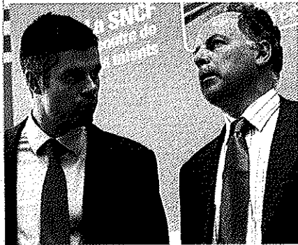
Laurent Wauquiez, le secrétaire d'Etat à l'Emploi (à gauche), pilote la fusion. Christian Charpy, le DG de Pôle emploi, exécute les ordres.

La plate-forme téléphonique (le fameux 39 49) destinée à désengorger les agences? Près d'un tiers des coups de fil restent sans réponse, et on peut toujours courir le 100 mètres pour être rappelé. L'inscription en cinq jours au maximum? Elle est officiellement assurée dans 90% des cas, mais les témoignages de chômeurs baladés pendant des semaines dans les bureaux sont si fréquents qu'il est permis d'en douter. Le suivi mensuel des demandeurs d'emploi? Il fait rigoler tout le monde dans la maison: en