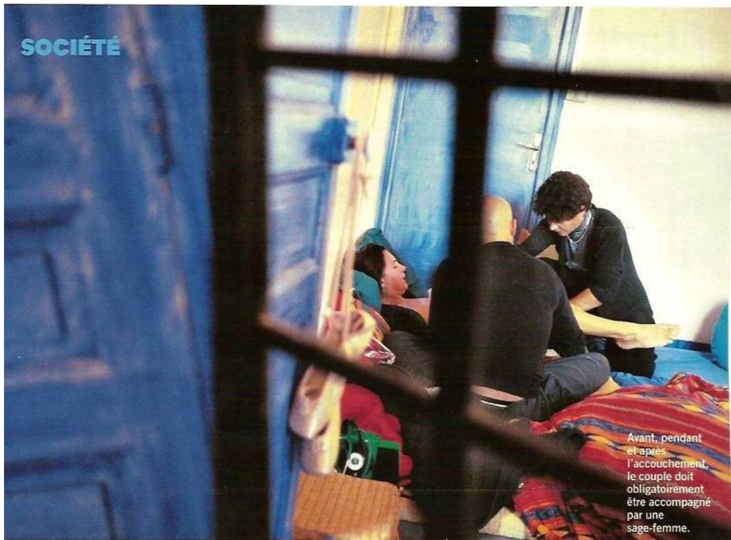
Avant, pendant et après l'accouchement, le couple doit obligatoirement être accompagné par une sage-femme.