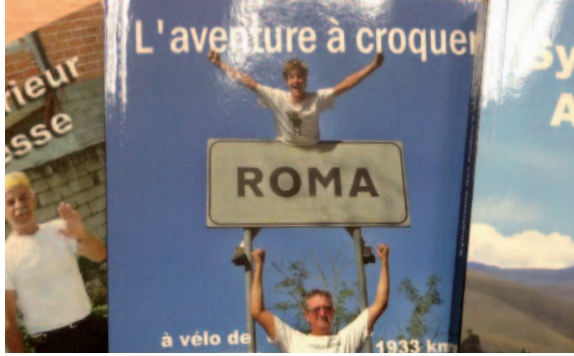
Les carnets de voyage de Jean-Luc Mercier sont disponibles sur son site www.janodou.com