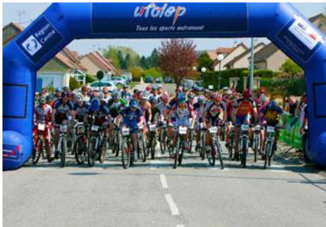
Arche de départ