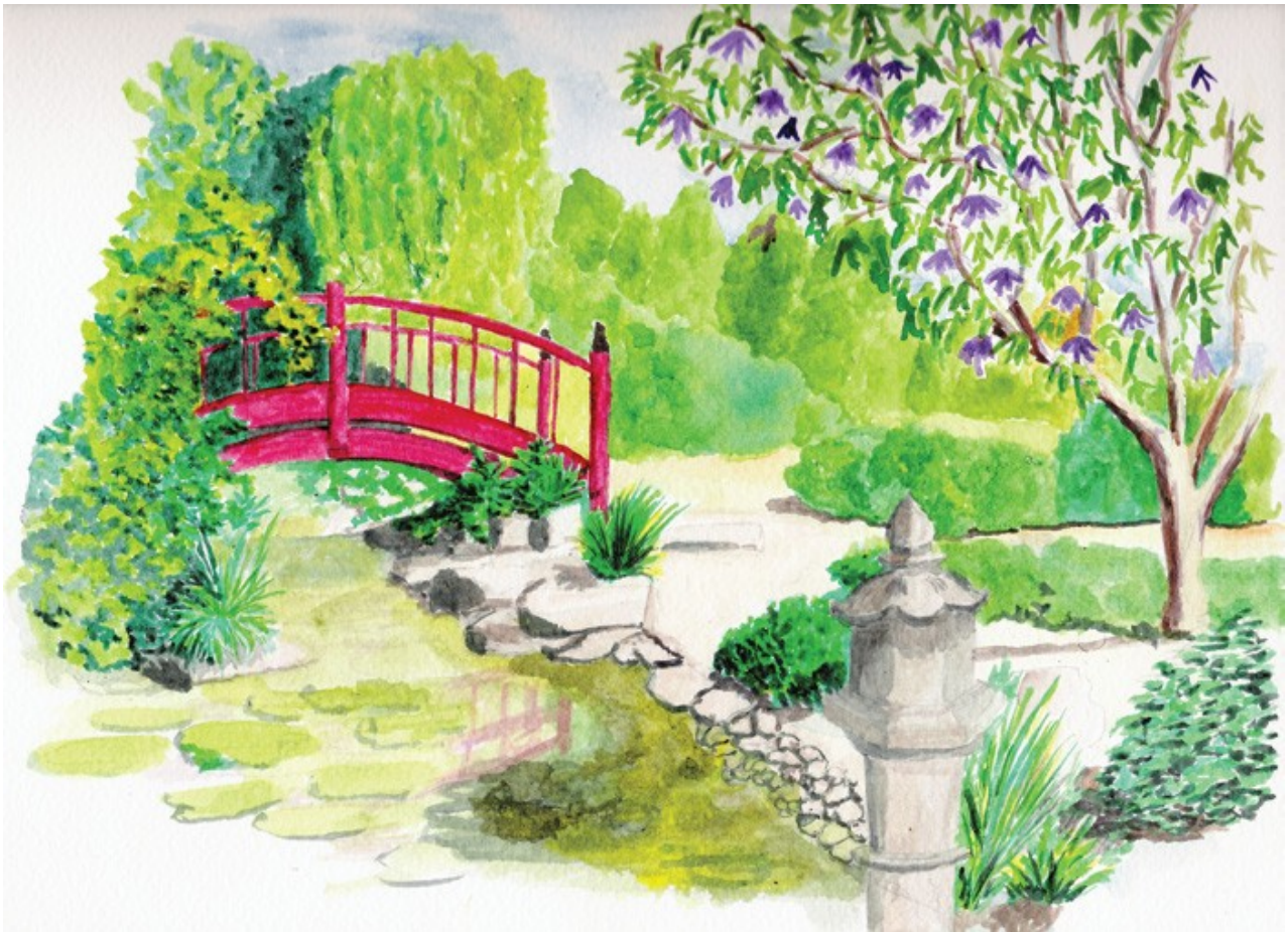
Le Jardin Zen à Rueil-Malmaison – Peinture à l'encre – Jacques Buvat

Parfument l'air vives et pleines de couleurs les fleurs s'épanouissent