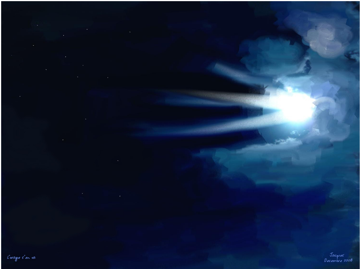
L'orage s'en va – Peinture numérique – Jacques BUVAT

L'orage s'en va, L'orage est au loin. Et moi... ce bleu me donne soif.