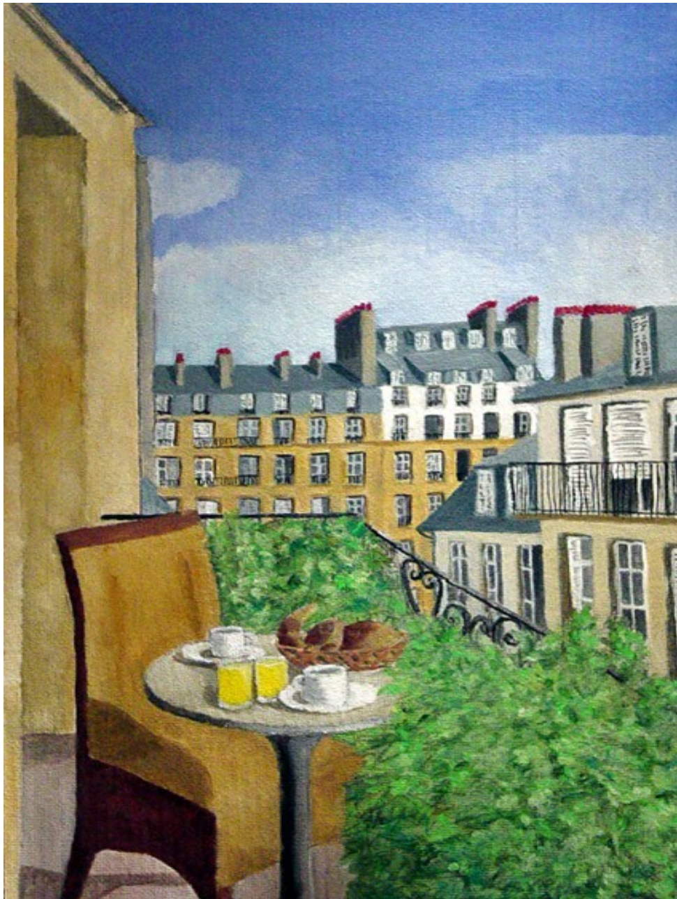
Petit déjeuner à Montmartre – Huile sur bois – Jacques Buvat

Terrasse parisienne Voie lactée dans mon café Au goût de l'été.