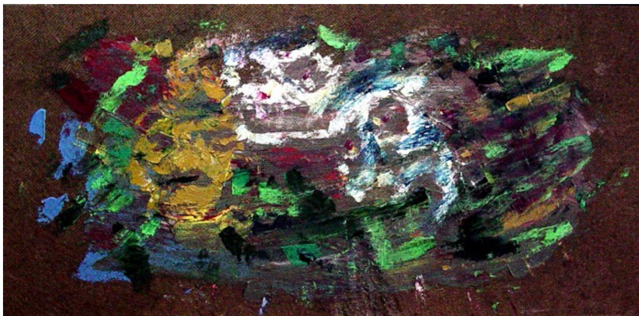
Les chimères – Huile sur bois – Jacques BUVAT - 20006

Au bras de Morphée, Les messagers de la peur Noircissent nos rêves.