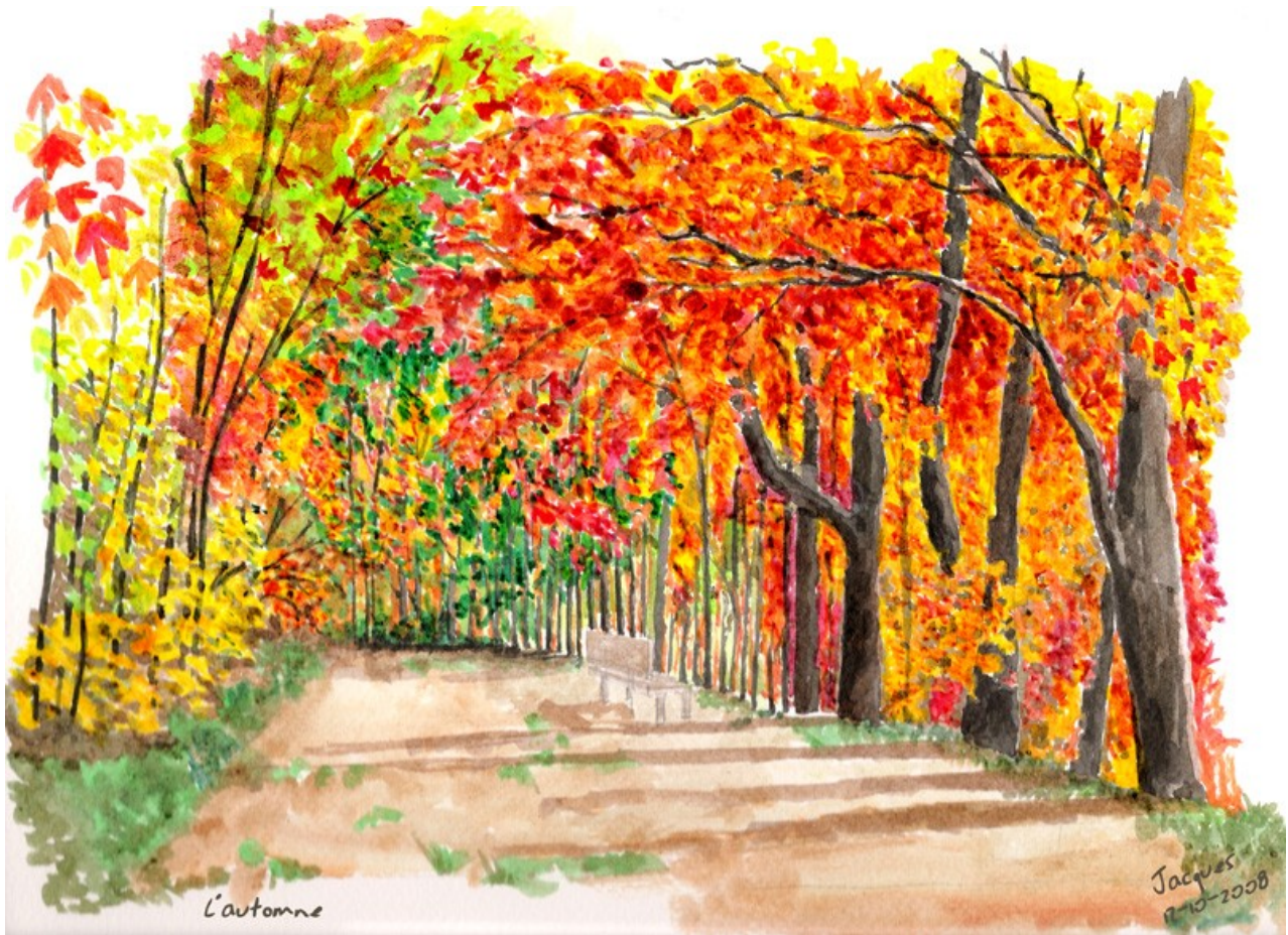
L'allée du Jardin des Plantes – peinture à l'encre – Jacques Buvat

Feuilles fatiguées Feu d'ocre rouge orangé Automne dansant