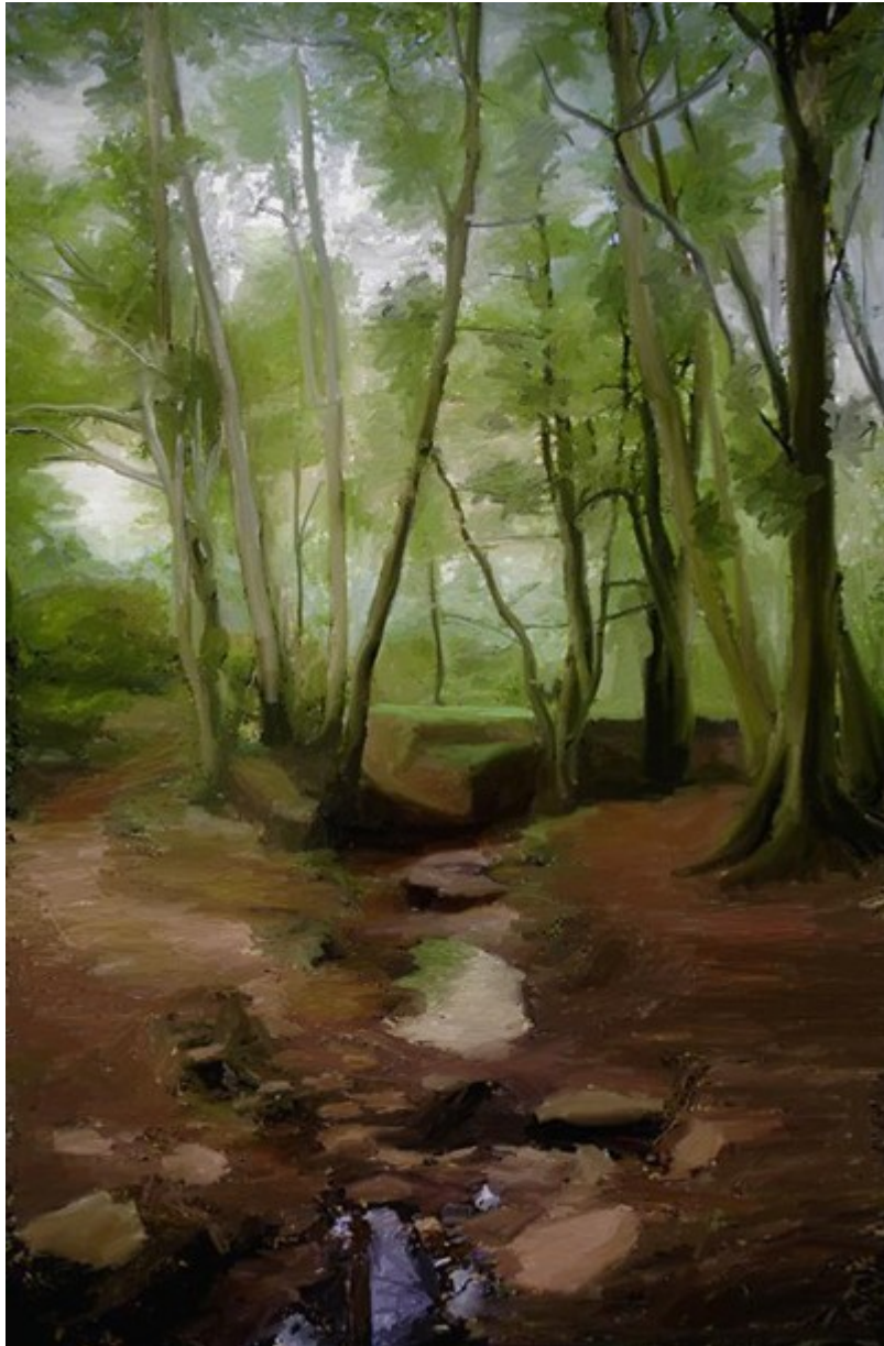
Forêt de Brocéliande – Le Val sans retour – Peinture numérique – Jacques Buvat

Avec l'horizon La lumière verdoyante Mange du gazon