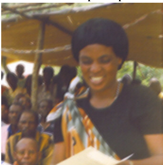
2004, la vice-mairesse s'adresse à la population.

D'abord, les mouiroirs sont bondés de gens innocents qui y subissent une destruction lente et cruelle, des gens qui ne peuvent que se résigner à ce sinistre sort.