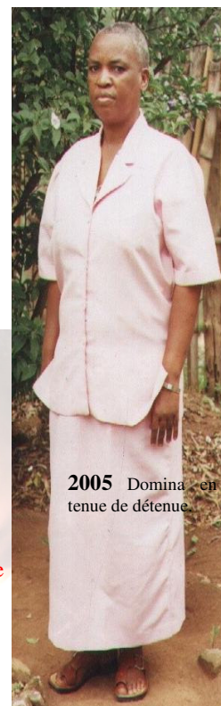
2005 Domina en tenue de détenue.

Et elle n'est pas la seule, Des Domina hommes et femmes sont des centaines de milliers au Rwanda, que notre indifférence condamne inexorablement.