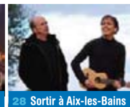
28 Sortir à Aix-les-Bains