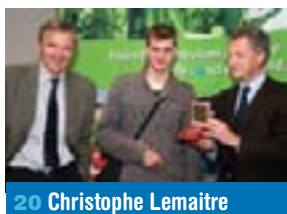
20 Christophe Lemaître

/// SIERROZ-FRANKLIN-LAFIN /// LIBERTÉ /// MARLIOZ /// SAINT-SIMOND/CHANTEMERLE/BONCELIN /// BORDS DU LAC /// CENTRE-VILLE