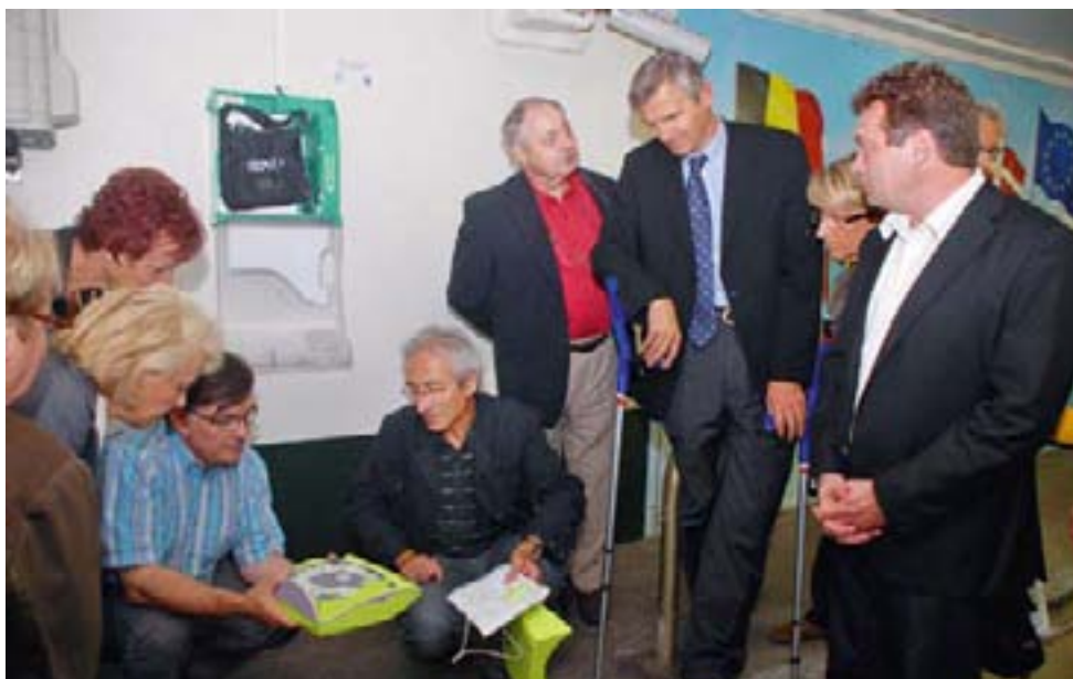
Inauguration du défibrillateur du parking de l'Hôtel de Ville

Dernier exemple en date, elle en a inauguré un nouveau (financé avec le soutien de la fondation CNP Assurances) au parking de l'Hôtel de Ville en septembre. Cela porte à sept le nombre de défibrillateurs qu'elle a mis en place. Les six autres sont situés au Kiosque aux projets communaux (place Clemenceau), au stade Jacques Forestier (dans la loge du gardien du stade), au Centre nautique (un à la plage et un à la piscine), au foyer de Crolles l'hiver et au Service des sports de la Mairie. Mais ce dernier est mobile, c'est-à-dire qu'il est prêté aux associations qui en font la demande