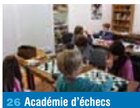
26 Académie d'échecs