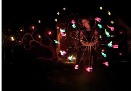
Cie Zoolians, « La lueur de Zéïs »