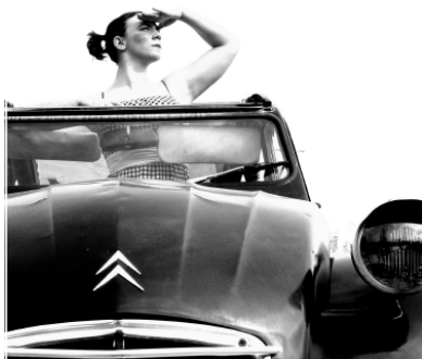
Cie Mel & Vous,