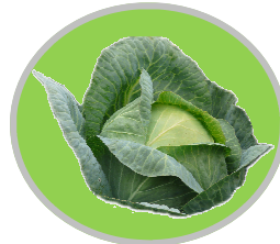
Choucrouterie Laurent, Blignicourt

Spécialiste de la choucroute depuis 1945, l'entreprise bénéficie d'un savoir-faire traditionnel qu'elle a su conjuguer avec une production industrielle pour répondre aux demandes à l'international, et vous