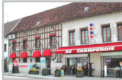
Restaurant Au Champenois, Piney

Ce restaurant de cuisine traditionnelle permettant de déguster les spécialités champenoises vous accueille dans une ambiance intime.