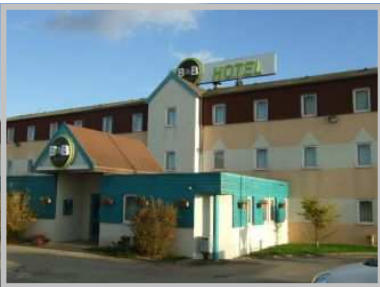
Hôtel B&B, Saint-Parres-Aux-Tertres