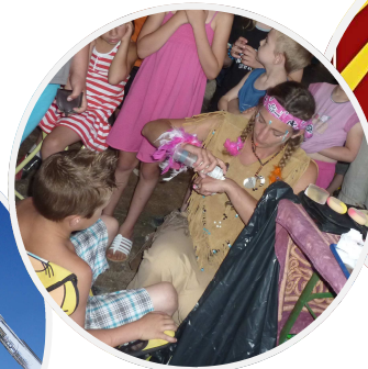
Cie Peg'Show, Maquillage