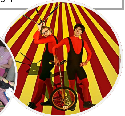
Cie Cirque du bout du monde « Wheeling et Bicloo »