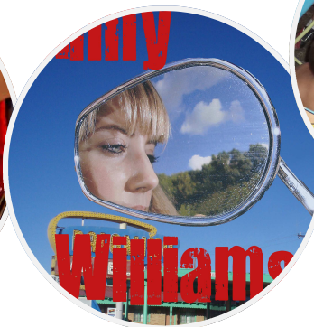
Fanny Williams Band Concert