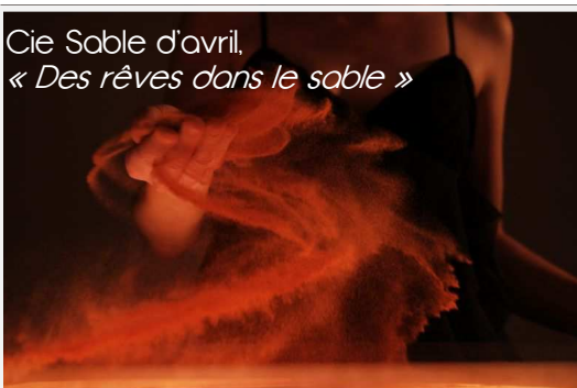
Cie Sable d'avril, « Des rêves dans le sable »