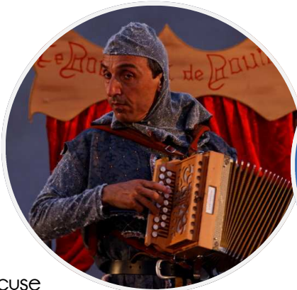
Cie Excuse « Le Bouillant de Bouillon »