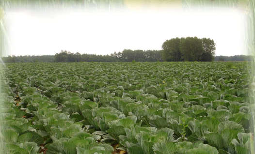
Champ de choux à choucroute