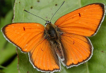
Le Cuivré des marais