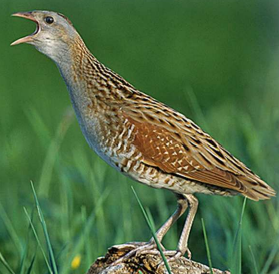
Le râle des genêts

Si vous êtes observateurs et si vous laissez vos sens en alerte, préparez-vous à des rencontres exceptionnelles !