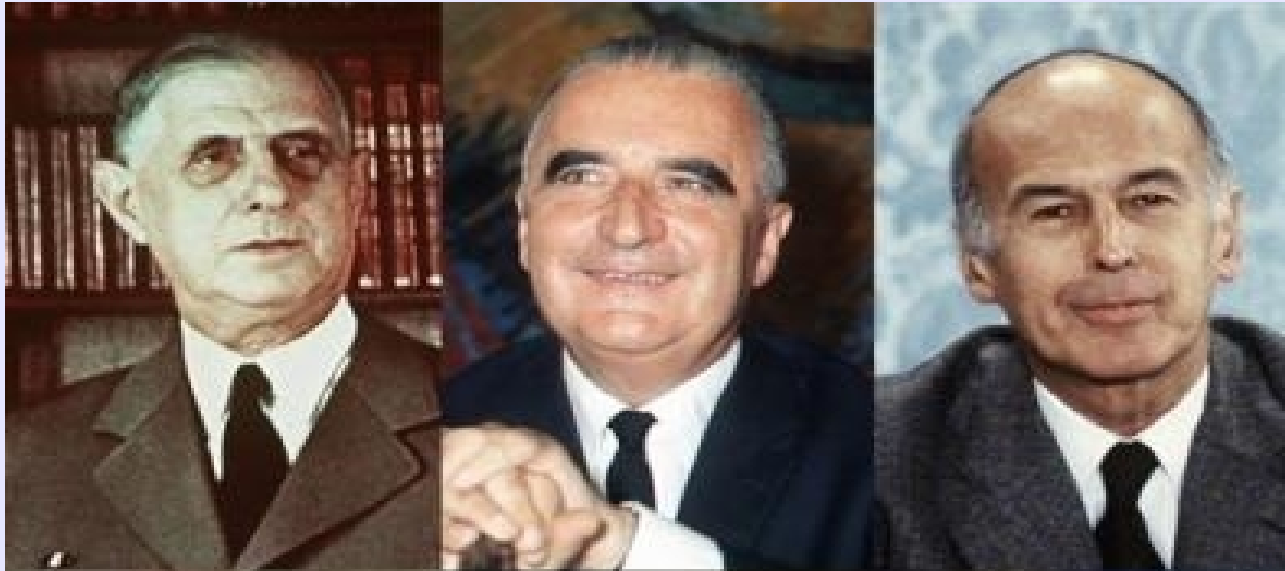
Georges Pompidou président de la République de 1969 à 1974