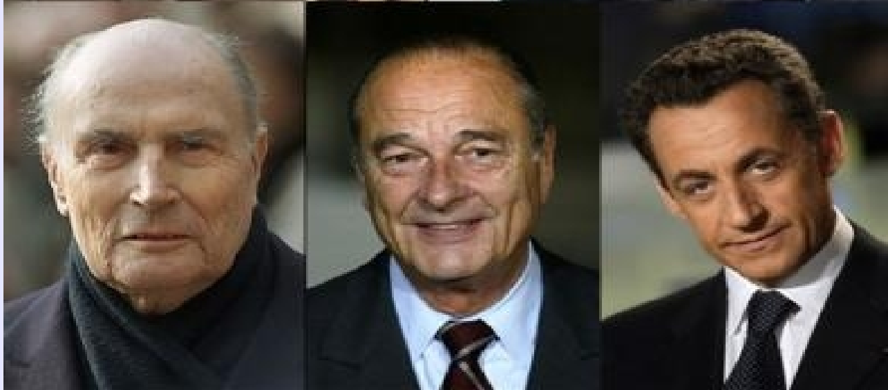
Jacques Chirac président de la République de 1995 à 2007