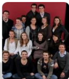
Talent de l'équipe Abbeville hockey sur gazon