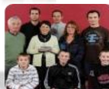
Talent du collégien OMNISPORT : Collège du Ponthieu Abbeville