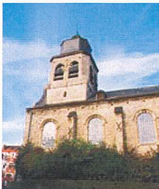
Eglise Saint-Nicolas | Sint-Niklaaskerk.