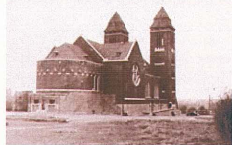
La nouvelle église de Neder-Over-Heembeek | De nieuwe kerk van Neder-Over-Heembeek

les troupes des Berthouts, les Seigneurs de Grimbergen. Le Duc Godefroid II n'était à l'époque qu'un bambin de deux ans que l'on avait amené sur le champ de bataille pour prendre la tête de son armée dans un berceau qui fut suspendu à la branche d'un arbre. Du haut de son trône, Godefroid exprima tout le mal qu'il pensait des Berthouts : il se dressa dans son berceau et de là-haut il pissa sur son ennemi. Les soldats victorieux portèrent ensuite en triomphe le berceau de leur duc jusqu'à Bruxelles. Manneken-Pis était né. Les historiens mettent fortement en doute cette version des faits et se demandent même si cette bataille a jamais eu lieu. Mais l'histoire reste très drôle !" ■