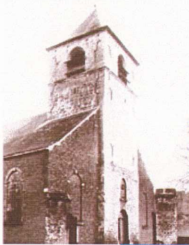
L'église de Neder-Heembeek avant son incendie | De kerk van Neder-Heembeek voor de brand.