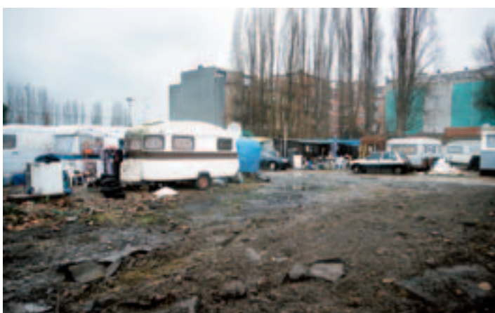
ILS GAGNENT UN DÉLAI DE GRÂCE. Depuis le 26 janvier, des résidents de caravanes se battent contre leur expulsion.