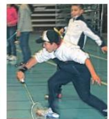
Même après le tournoi, on continue de jouer, toujours avec plaisir.

Pour clôturer ce tournoi, joueurs et supporters se sont