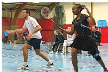
Le double mixte compétiteur lors de la première journée de Régionale 2.

Le club de badminton de l'ASF (Alerte sportive) a organisé, le 10 novembre, la première journée de championnat R2 à Fondettes. La Choisille n'a pas réussi aux Fondettois qui ont débuté par deux défaites.