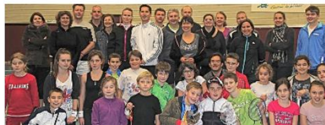
Après les jeux, la photo-souvenir.

La section badminton a organisé son tournoi interne ce dimanche à l'espace municipal de la Choisille. Six équipes composées de sept joueurs se sont rencontrées tour à tour pendant tout l'après-midi. Une nouvelle formule a été