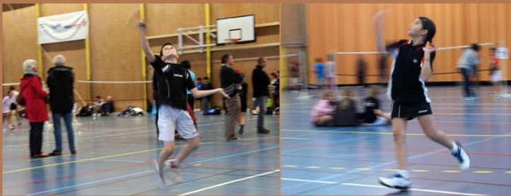
Plus d'informations sur le badminton fondettois sur le site www.asfbadminton-fondettes.com .