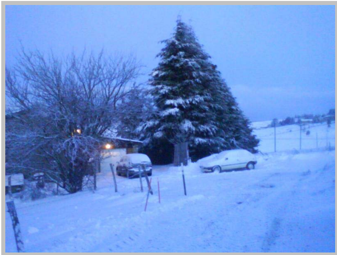
Le gite du pré au petit matin

Nos hôtes ne paraissaient pas inquiets pour deux sous .... Finalement temps superbe le Dimanche et routes dégagées par la DDE locale .... Super