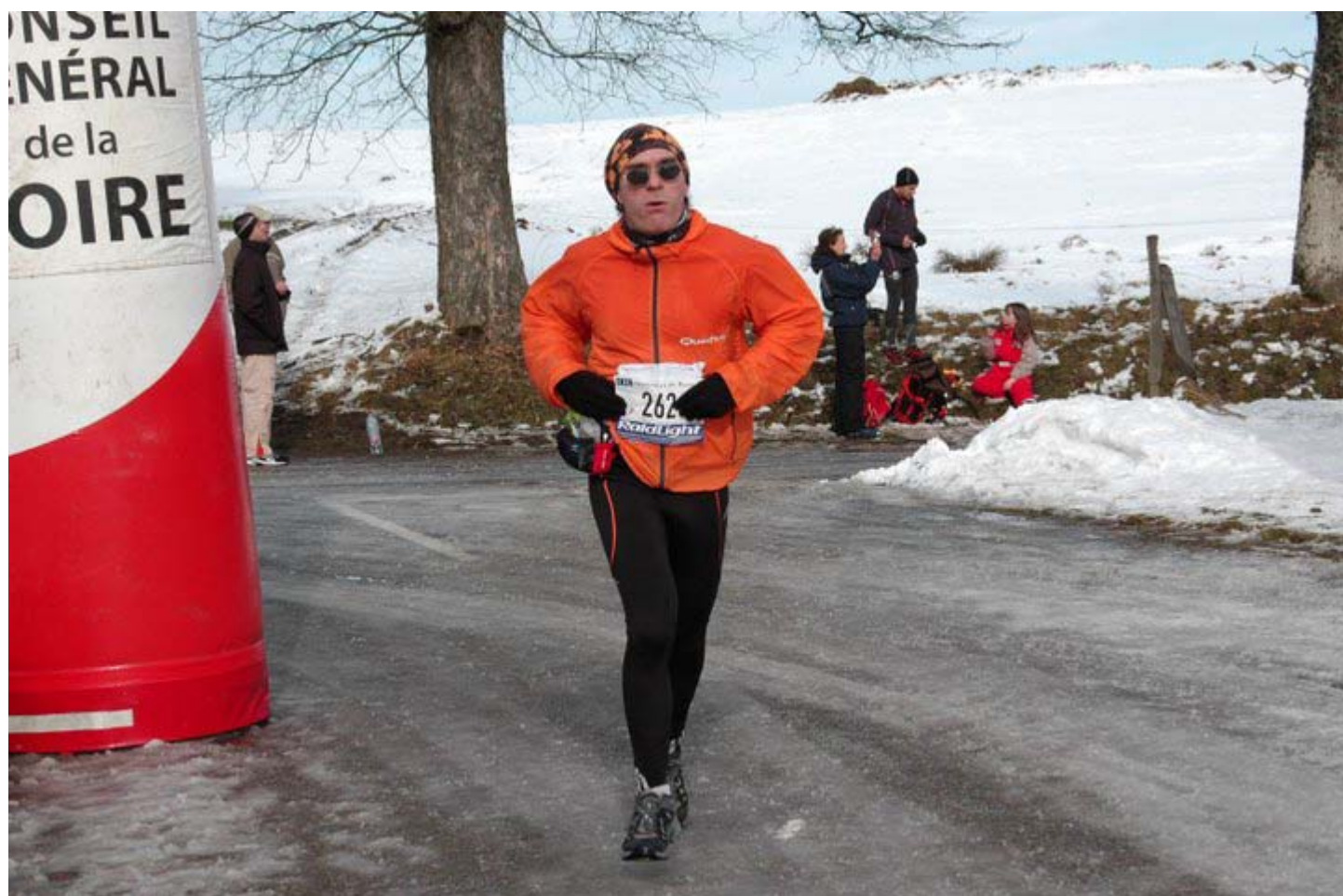
Et le Poucet ferme la marche, 95ème en 4h18

Voilà, voilà, ci ça peut donner quelques idées à certain ... Personnelement j'apprécie beaucoup de varier les objectifs entre le trail et le vélo.