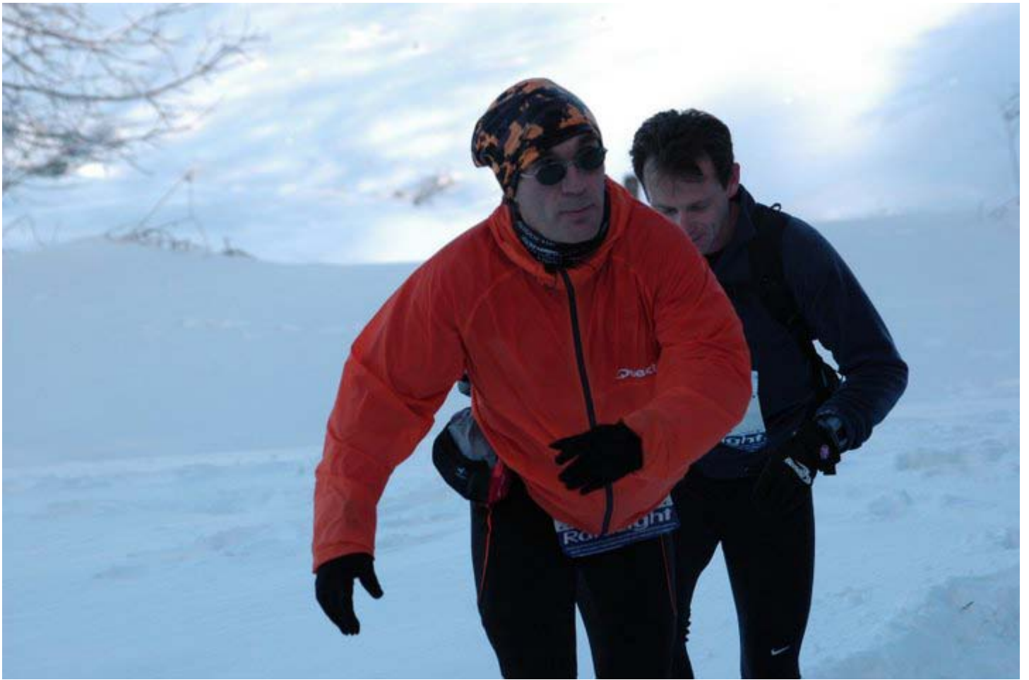
Poucet dans la galère