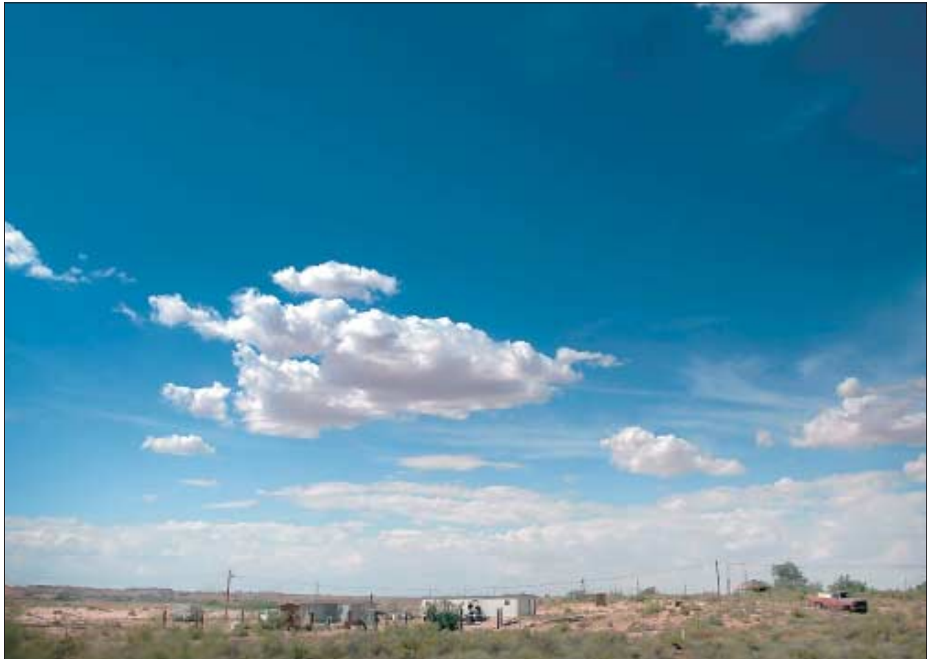
Perdre son emploi, c'est aussi perdre son toit. Les associations caritatives ne parviennent plus à faire face à la demande. Les petits boulots, payés à cent dollars la semaine, n'autorisent aucun rêve.