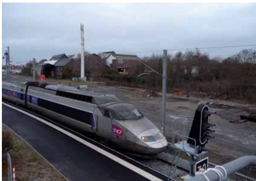
Entrée triomphale du T.E.R GV en gare de Rang du Fliers

Un souhait à formuler pour l'avenir: que les élus de la Somme emboîte le pas aux élus du Nord-Pas de Calais et que dans un avenir proche, toute la ligne soit du même acabit jusqu'à la capitale. On pourra alors s'exclamer que le renouveau de la Côte d'Opale est sur de .....bons rails.