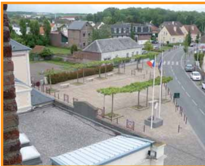
Côté Sud : La « Place de la Paix » nous dévoile le feuillage en quinconce de ses arbres