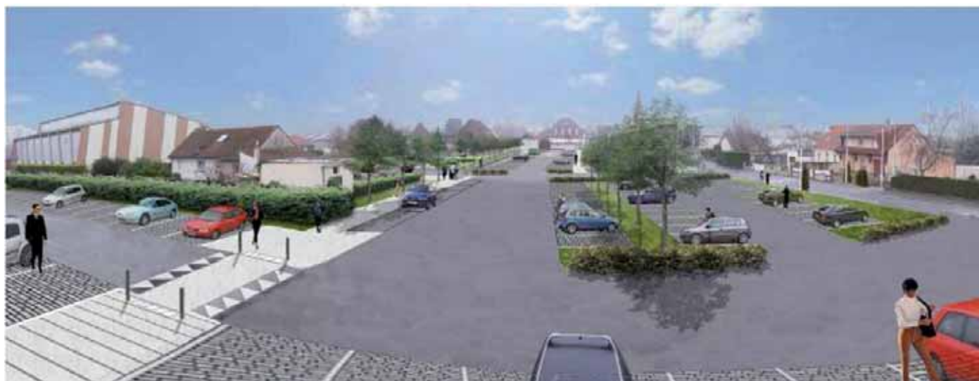
Voici en avant-première l'esquisse du parking paysager qui va redessiner l'ensemble du quartier de l'Eglise. Mise en route des pelleteuses dès l'automne prochain

C'est ce type d'appareil qui se trouve à l'entrée de la Salle Bleue-Jean Szymkowiak et qui, en suivant la notice simplifiée d'utilisation, peut permettre d'intervenir en cas d'alerte respiratoire.