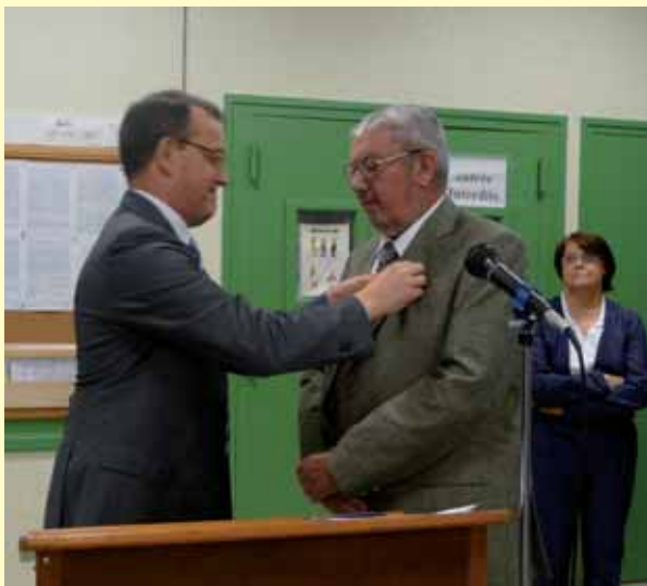
L'inspecteur d'Académie épinglant le récipiendaire

Il n'y a donc plus qu'à se joindre à cette sympathique équipe pour se lancer sur la trace de ses aïeux, soit en franchissant la porte du Centre, soit en allant visiter le site Internet à l'adresse suivante : http://aghve.verton.free.fr