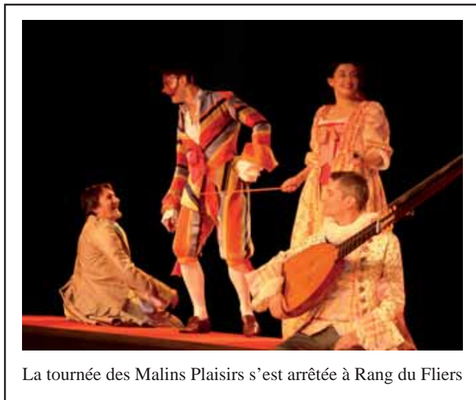
La tournée des Malins Plaisirs s'est arrêtée à Rang du Fliers