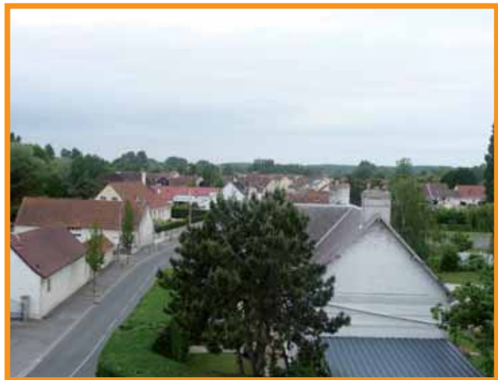
Côté Ouest : Les prémices de la route de Merlimont