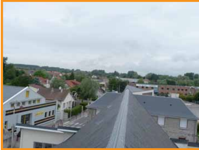
Côté Nord : Vue sur la Salle « Le Fliers » et sur le « Centre Administratif Municipal »