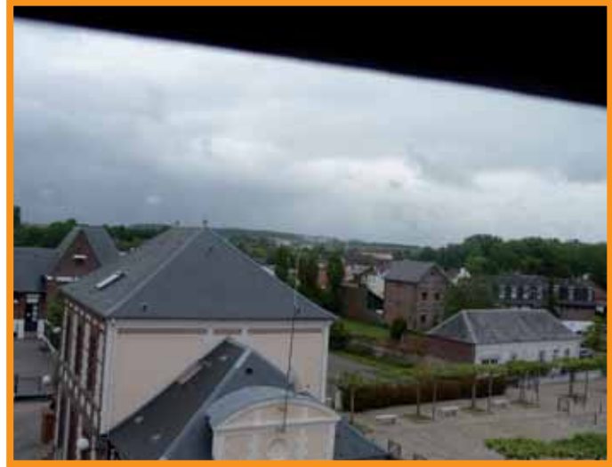
Côté Est : Panorama sur les écoles primaires, avec aperçu dans le lointain, du site du CHAM