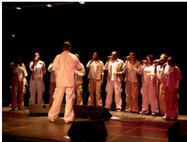
Le New Gospel Family et ses rythmes endiablés

La salle « Le Fliers » a désormais trouvé son rythme de croisière et se fait progressivement une place au soleil. Outre de nombreuses réunions d'informations inhérentes à la vie du canton, elle est devenue un lieu de spectacles incontournable. La programmation 2010 a ainsi proposé diversité et qualité : théâtre, musique, chant, folklore.